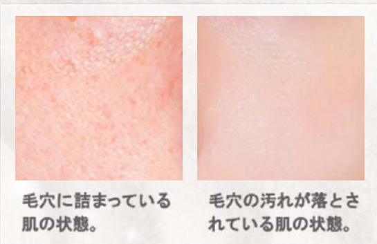
毛穴に詰まっている肌の状態。

そう感じたことはありませんか? それは塩を塗ることによって新陳代謝を上げていたからです。 老廃物がどんどん排出された肌は、毛穴がキレイに大掃除される事によってつるつるピカピカになるのです。